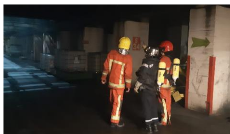
Exercice du 9 février (simulation incendie)

Le 4 mars, il s'agissait de la simulation de fuite de liquide toxique au RAPPY.