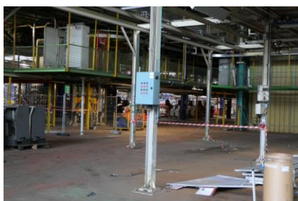
Ancienne zone de contrôle géométrie caisse Ferrage 208