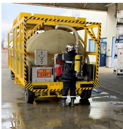
Exercice du 4 mars (fuites produits toxiques)