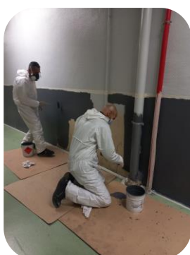
Bâtiment B2 : peinture du couloir de l'étage