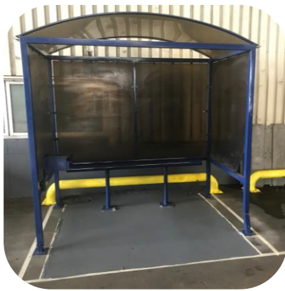
CPL : Fumoir du Parc à vide : Avant / Après