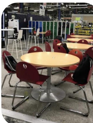
Montage : Nouveau mobilier pour la cafeteria à HC