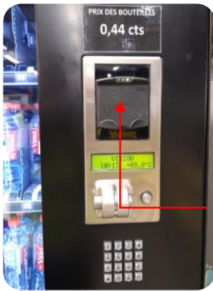
Positionnement carte de service

Depuis le 16 janvier, l'ensemble des machines de « Distribution Automatique » des ateliers sont en cours de renouvellement. Les nouveaux modèles ne fonctionnent pas avec les anciennes « clés bleues » mais avec les cartes de service (sur lesquelles il faut créer une piste « DA »). Le paiement s'effectue « sans contact » en positionnant la carte de service sur le lecteur. La piste DA peut être rechargée par Carte Bancaire et/ou par pièces (en fonction du type de machine).