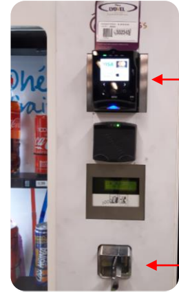
Recharge CB ou appli mobile